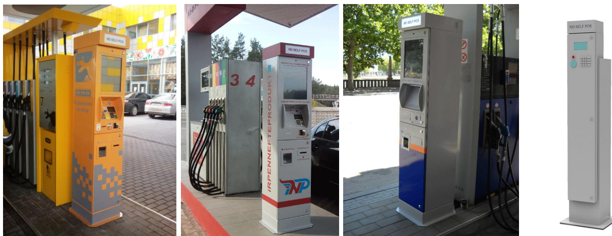
Автоматические платежные терминалы "ND SELF-POS"

Дополнительную информацию можно получить из технических и рекламных проспектов предприятий Группы компаний «НД», на ресурсе www.nd.ua , а также по телефонам (+38 044) 501-30-40, 501-40-91, 403-32-32.