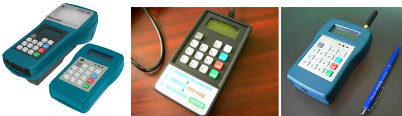
Терминал GPS-767 с бесконтактным пинпадом, USB-пинпад, радиопинпад