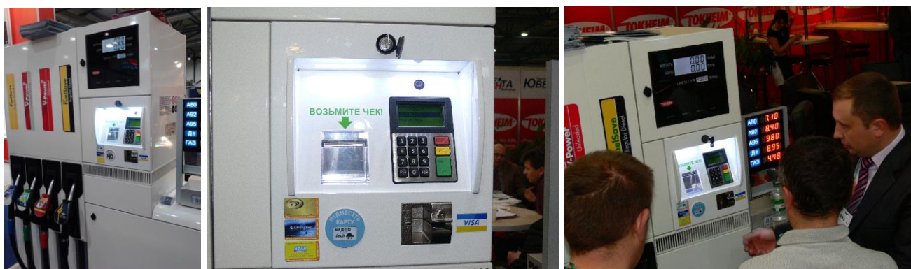
Терминал GPS-797, устанавливаемый под электронику ТРК